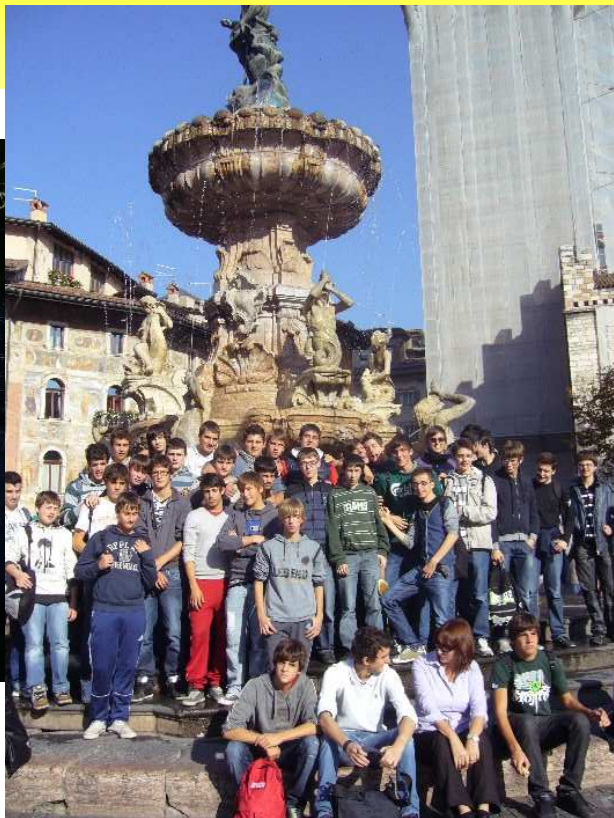
Trento: la fontana di Nettuno →