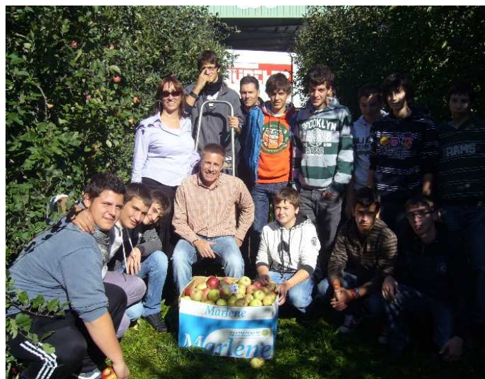
↑ Vadena: la raccolta delle mele di AGRITIME Foto di gruppo

Agritime PROGETTO DIDATTICO ADOTTA UN MELO IN ALTO ADIGE